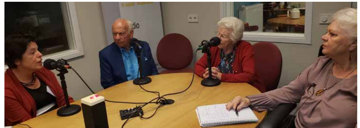
Infoblok 2018 Mantelzorg 24 september 2018

Het e-mailadres van de Werkgroep Tafeltje dek je is: tafeltjedekje@swomill.nl