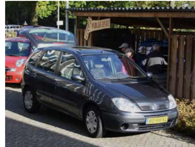
Auto's bij de losplaats van Tafeltje-dek-je

U kunt zich dagelijks telefonisch aanmelden voor een warme of koelverse maaltijd bij een van de onderstaande contactpersonen.