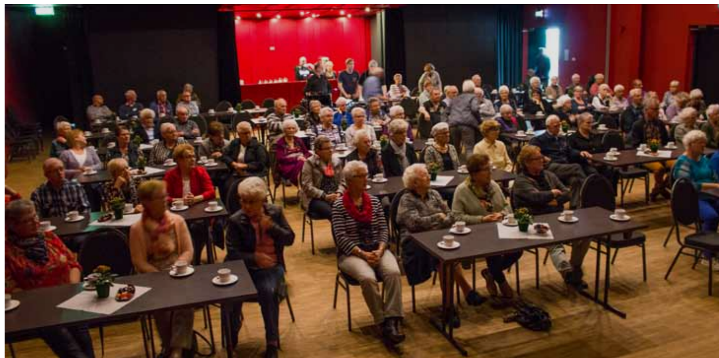
Zaal Bonte middag 2017

Tafeltje-dek-je is in principe bestemd voor mensen vanaf 55 jaar die niet in staat zijn om zelf voor een warme of een koelverse maaltijd te zorgen. In bijzondere omstandigheden kunnen ook alleenstaande jongeren met een beperking of bijvoorbeeld na een operatie, al dan niet tijdelijk, gebruik maken van Tafeltje-dek-je.