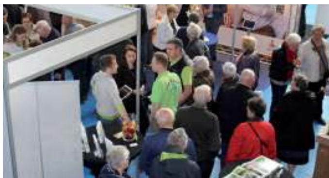
Om de twee jaar wordt de Regionale Seniorenbeurs georganiseerd