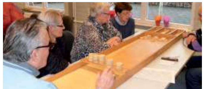
Sjoelen in de Wis

Wekelijks op maandagmiddag. Er wordt in een rustig tempo gefietst en de tocht is ongeveer 25 tot 30 km. Vanaf april tot eind oktober, maar als het weer het toelaat kan er ook langer doorgefietst worden.