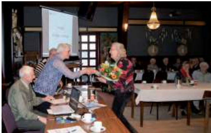
Jaarvergadering 2017 huldiging vrijwilliger van het jaar