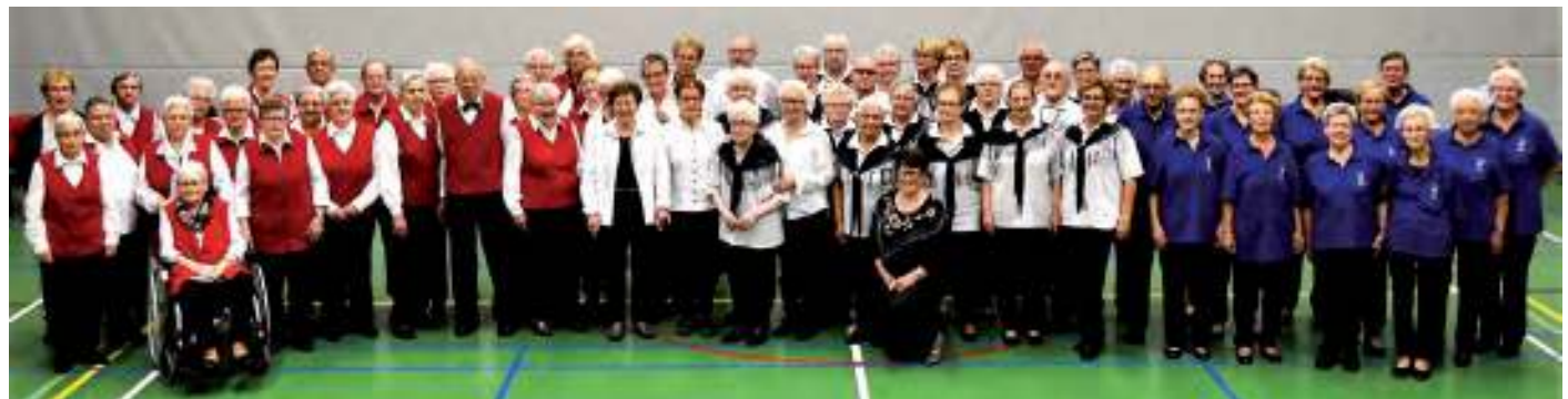
Groepsfoto country- en volksdans 2017