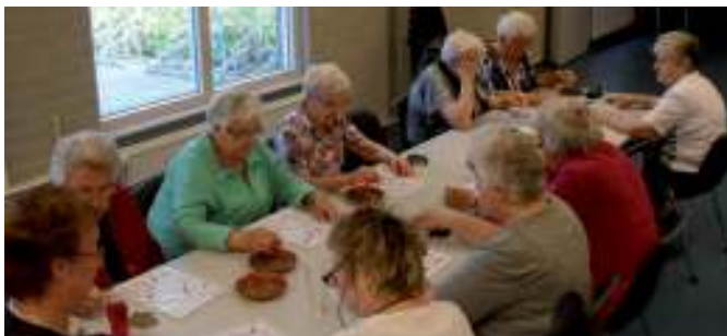
Kienen in de Wis

Elke 3e donderdag van de maand is het kienen. De eerste kienmiddag is 18 januari. De volgende data zijn 15 februari – 15 maart – 19 april – 20 september – 18 oktober – 15 november en 20 december. Kienkaarten kunnen tussen 13.30 en 14.00 uur worden gekocht en kosten € 5,00. De consumpties zijn voor eigen rekening.