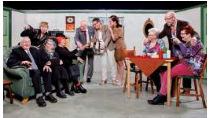
Toneelgroep Vier in Eén heeft tweemaal per jaar een nieuw blijspel